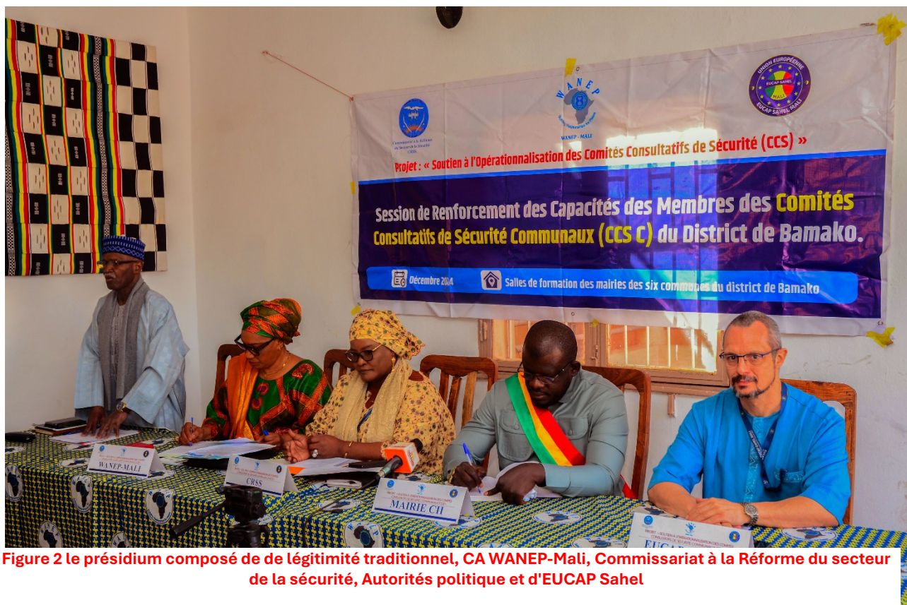
Figure 2 le présidium composé de de légitimité traditionnelle, CA WANEP-Mali, Commissariat à la Réforme du secteur de la sécurité, Autorités politique et d'EUCAP Sahel

WANEP-Mali a démontré qu’une sécurité durable repose sur des solutions co-produites, intégrant toutes les couches de la population. L’organisation reste engagée à poursuivre ses efforts pour promouvoir une gouvernance sécuritaire inclusive, tout en partageant les leçons apprises pour inspirer des initiatives similaires à travers le pays.