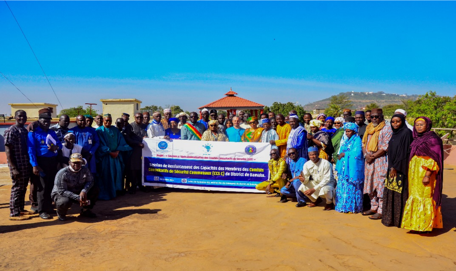
Figure 1 photo de famille

En 2024, WANEP-Mali s'est affirmé comme un acteur clé dans la promotion de la paix et de la gouvernance sécuritaire participative à travers des initiatives innovantes et inclusives. Parmi ses interventions phares figure le projet « Soutien à l'Opérationnalisation des Comités Consultatifs de Sécurité Communaux (CCS-C) », une initiative stratégique mise en œuvre dans les six communes du district de Bamako.