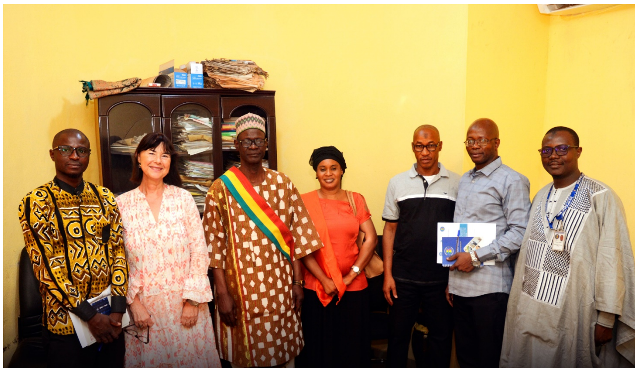
Figure 3 rencontre avec les autorités politique de la commune V du district de Bamako par l'équipe d'EUAP SAHEL ET WANEP-MALI